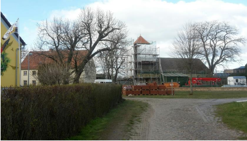
Abbildung 27 Anblick Kirchvorplatz am 03.04.2020

Wir vertrauen, dass Gott unser Tun segnet und uns Glauben und Kraft schenkt zum Werk. Gott segne unsere Gemeinde, unsere Kirche und unser Volk.