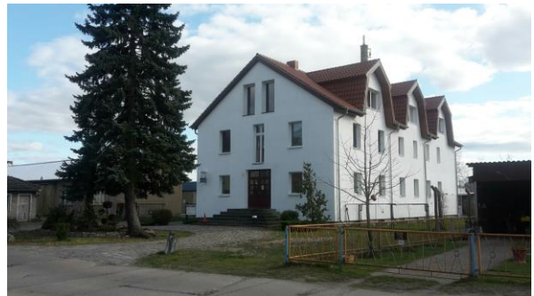
Abbildung 22 ehemaliges LTA-Gebäude