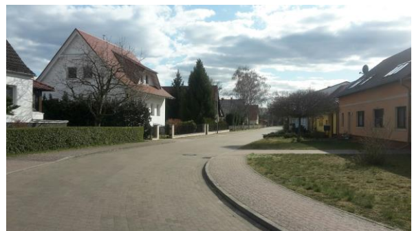
Abbildung 25 sanierte Straße am Gutshof