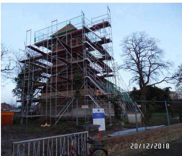
Abbildung 7 Die Sanierung beginnt