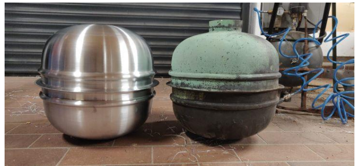
Abbildung 13 Neue und alte Kugel im Vergleich

Das Dach der Kirche wurde zuletzt 1969 gedeckt. Als die alte Kugel 2020 geöffnet wurde befand sich darin: