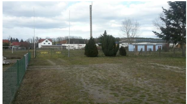
Abbildung 21 Blick auf den Sportplatz mit Mehrzweckgebäude sowie im Hintergrund ehemaliges LTA-Gelände (heute Kranepuhl)