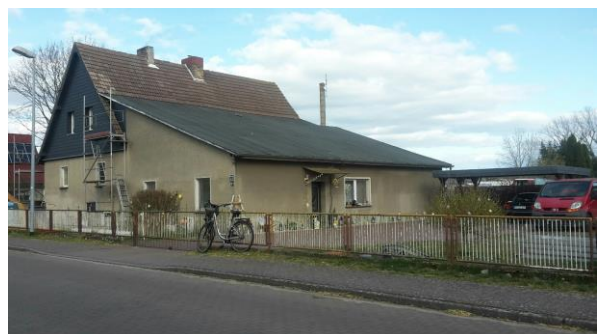
Abbildung 23 ehemaliger Kindergarten