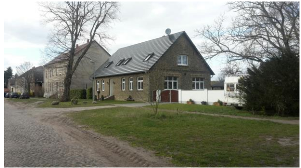
Abbildung 20 Alte Dorfschule mit Blick auf die Straße