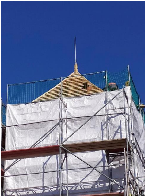
Abbildung 10 Turm fast fertig