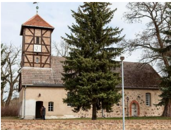
Abbildung 2 Kirchenimpressionen