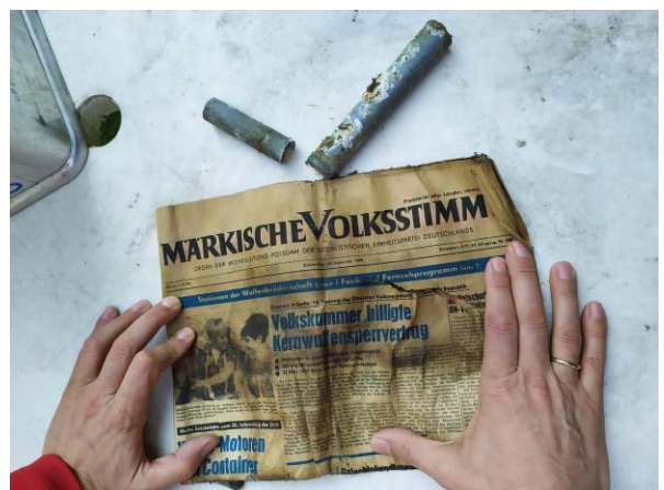
Abbildung 15 Märkische Volksstimme 1969