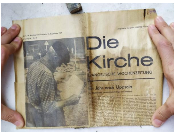
Abbildung 14 Die Kirche 1969

Das Dach der Kirche wurde zuletzt 1969 gedeckt. Als die alte Kugel 2020 geöffnet wurde befand sich darin: