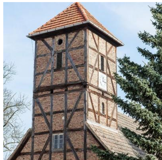
Abbildung 5 Der Kirchturm