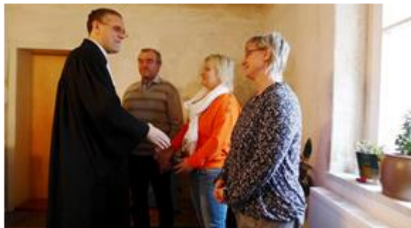
Abbildung 16 Einführung Gemeindegemeinderat am 19.01.2020 - Ja, mit Gottes Hilfe!