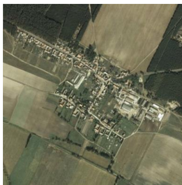
Abbildung 18 Luftbild von Neuendorf