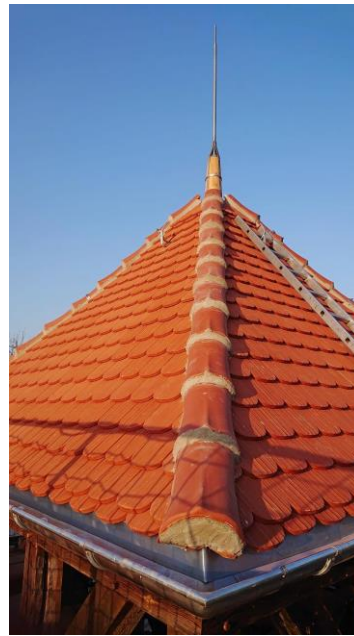
Abbildung 11 Turm ist fertig