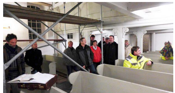
Abbildung 8 Besprechung Arbeitseinsatz