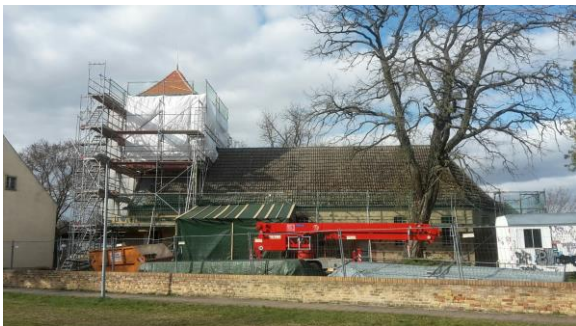
Abbildung 12 Dem Turm fehlt nur noch die neue Zier