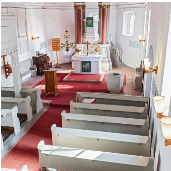
Abbildung 3 Innenansicht