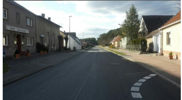
Abbildung 24 Impressionen Hauptstraße, später Neuendorfer Straße sowie Gaststätte Querndt