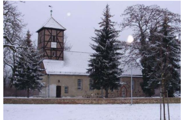
Abbildung 4 Kirchenimpressionen