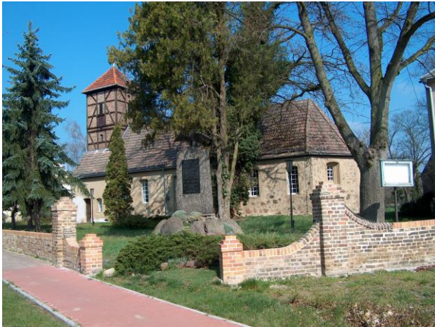
Abbildung 1 Kirchenimpressionen