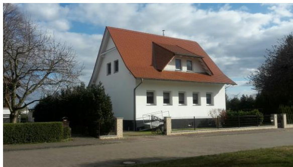
Abbildung 19 Ehemaliger Konsum jetzt Wohnhaus