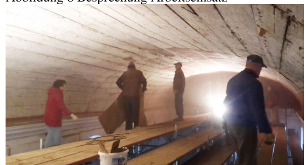
Abbildung 9 Viele fleißige Helfer beim Arbeitseinsatz